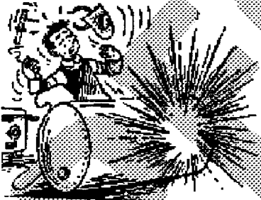
Fig. 1. Ontploffing als gevolg van een onvolledige "ontgassing"